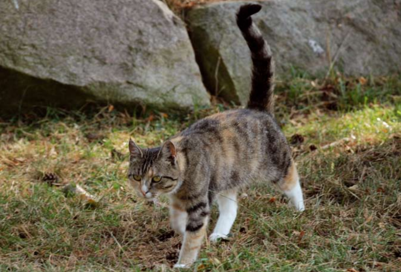
Miss Ahsoka - muligvis på vennejagt?