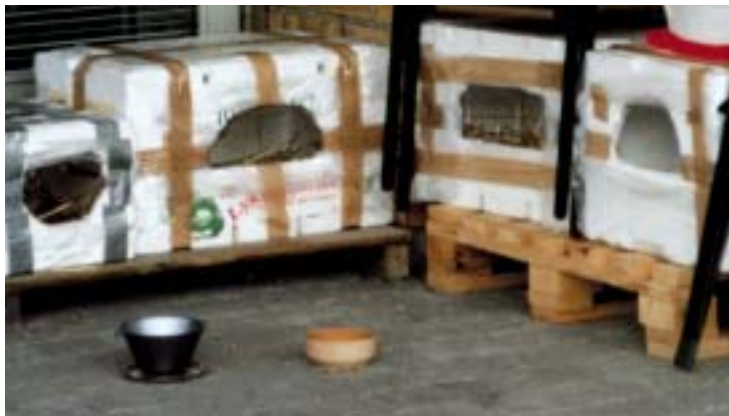
Forslag til hvordan redekasser kan bygges og stilles op

Inges Kattehjem ønsker alle vores læsere et godt efterår.