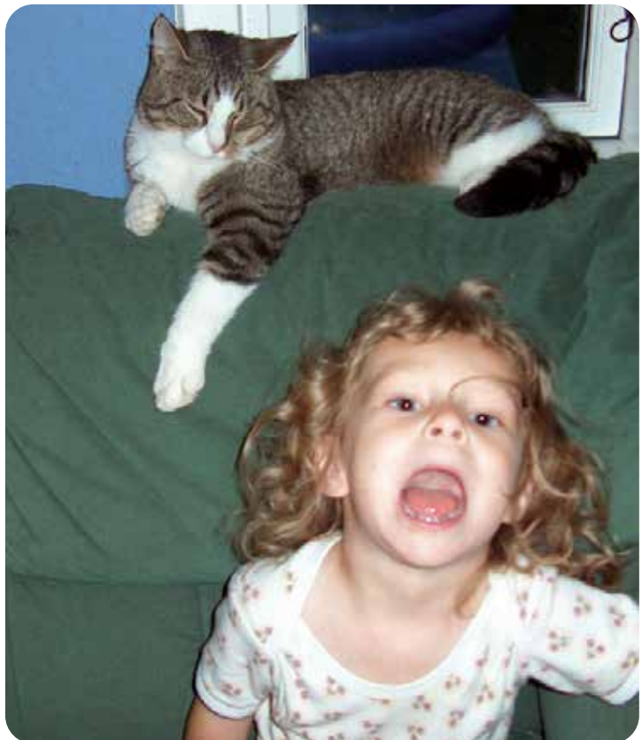
"Moar! Jeg prøvede at give katten kjole på, men den kunne ikke lide det!"

Sæt dig sammen med din datter og kæl forsigtigt med katten, når den er i godt humør. Efterhånden vil hun se, at hun sagtens kan omgås katten på dens egne præmisser, og at der ikke længere er noget at være urolig for.