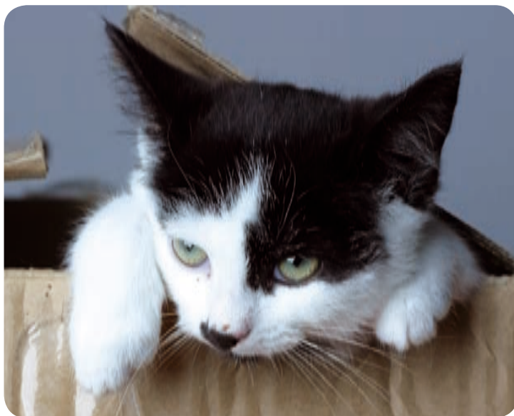
Hvad sker der med Mads? Følg med i næste nummer...

Uden at se mig tilbage masede jeg mig vej igennem dette tætte krat, og selvom de spidse