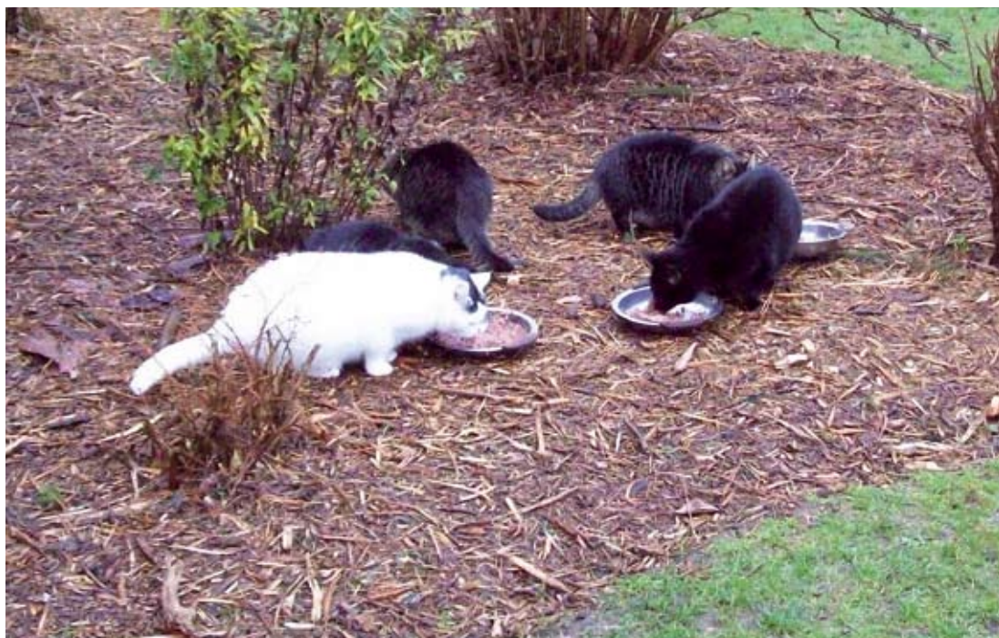
6 personer deler arbejdet med at fodre kattene hver dag på skift.

Jeg fortalte mange af de lokale beboere om vores indsats for