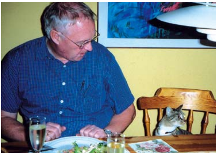
”Vores kat sidder altid med ved bordet, men den tigger aldrig.”

Husk IKKE at fodre ved middagsbordet for at undgå tiggeri.