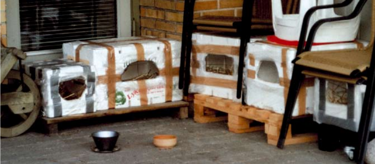
Læhuse til de vildtlevende katte.

områdets vildtlevende katte, og mange støttede mig økonomisk i mit arbejde. Vi kontaktede også grundejerforeningen, som gav et pengebeløb til indsatsen for kattene.