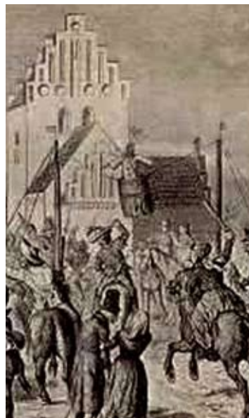
Tøndeslagning i 1800-årene. Ved denne lejlighed er "katten" en dukke.

nogen overtro i forbindelse med katte her i Danmark. En sort kat, der krydser vejen, siges at bringe ulykke – i nogle lande betyder det dog lykke. Følgende udtryk stammer da også fra Middelalderen, hvor man ikke turde nævne "den onde" (Fanden selv) ved navn: "Det var kattens", "fy for katten", "av for katten". Udtryk, der stadig bliver brugt den dag i dag. Både som gammel vane, men også af folk, der ikke kan lide at bruge de "rigtige" bandeord. Vi ved jo alle sammen, hvilket ord, vi kan skifte "katten" ud med.