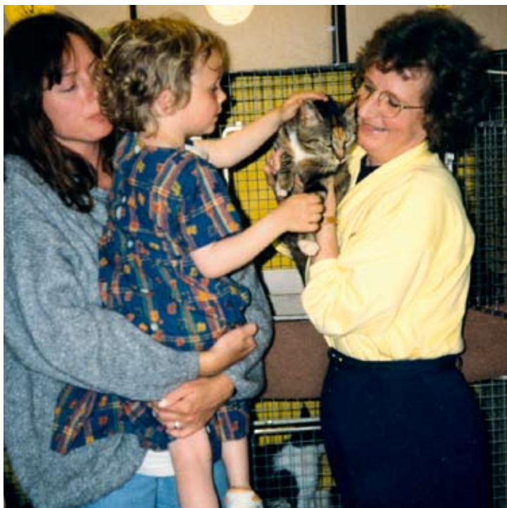
Allerede i 1995 var der rift om kattene på Kattehjemmet i Næstved.

En dag, jeg var på Kattehjemmet, sad en lille grå killing og kikkede på mig. Hun mindede så meget om Pjuske. Om aftenen da jeg var kommet i seng og savnede, at Pjuske lå ved siden af og spandt, besluttede jeg mig for at adoptere den lille grå killing og den sort/hvide søster. Det skete dagen efter.