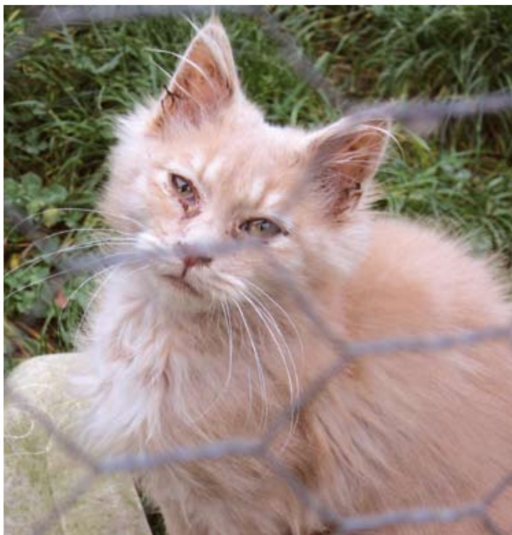
Check altid dyret og dets omgivelser/betingelser, inden du køber det.