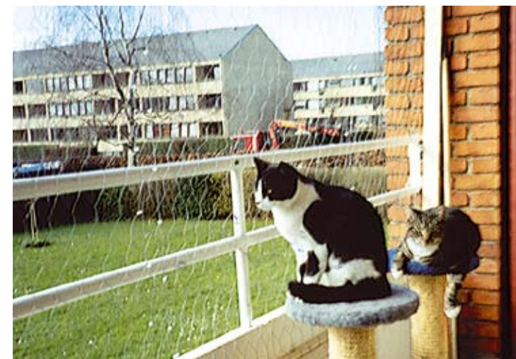
Der er net for altanen, så kattene ikke kan komme galt afsted.

Min nabos hankat tisser på min terrasse. Jeg kan ellers godt lide katte, men dette kan jeg ikke acceptere. Hvad gør jeg?