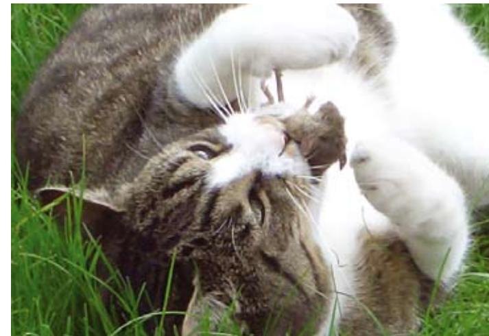
Katten har altid været en nødvendig skadedyrsbekæmper.

I næste blad kan du læse om kattens fortsatte historie fra hedensk tid, hvor katten blev forgudet, til Middelalderen, hvor katten fik en helt anden rolle som led i hekseforfølgelserne.