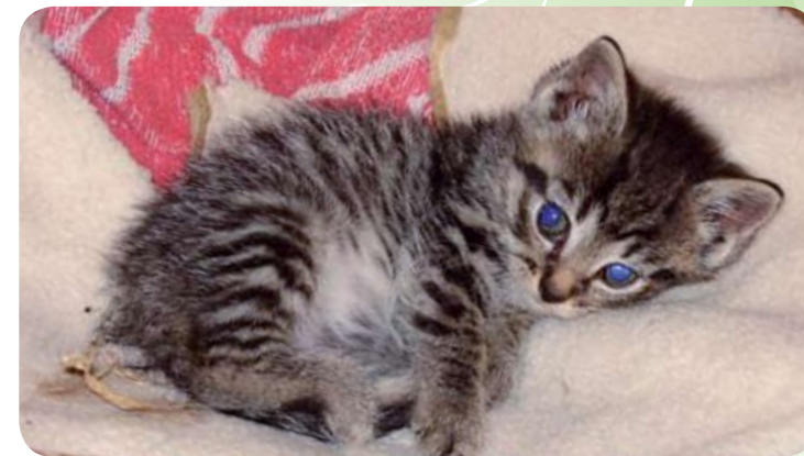
Killingen Perle, der overlevede.