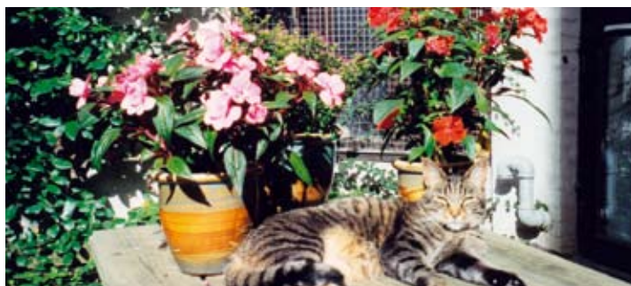
Det kan være risikabelt at være "gårdkat" inde i byerne.

tager på, skal de have mere mad og evt. til dyrlægen for et sundhedscheck. Til slut vil jeg bede dig om at få din hunkat steriliseret, da der er rigeligt med hjemløse killinger i forvejen! Du kan få det gjort, når killingerne begynder at spise selv, dvs. når de er 4-5 uger gamle.