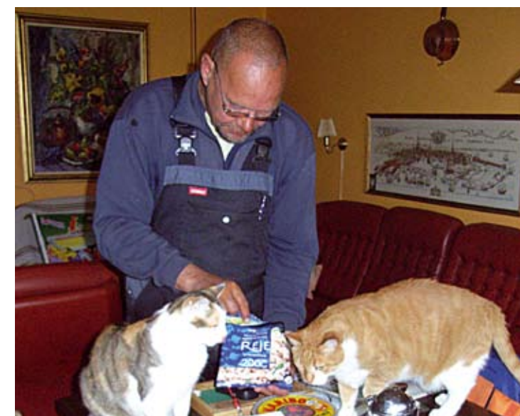
Dyrene er ofte eneste samvær for enlige og ensomme mennesker.

Til gengæld kan du have god samvittighed over, at der tages hånd om dine katte, hvis der sker dig noget.