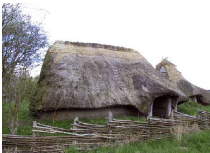
Den romerske jernalder

Fra Sydeuropa er de med stor sandsynlighed blevet bragt nordpå af romerne i takt med deres erobringer. De koloniserede Tyskland ved Rhinen og Britannien, dagens England, for ca. 1.800 år siden – i den såkaldte "Romerske Jernalder". Man har fundet knogler af tamkatten under udgravninger