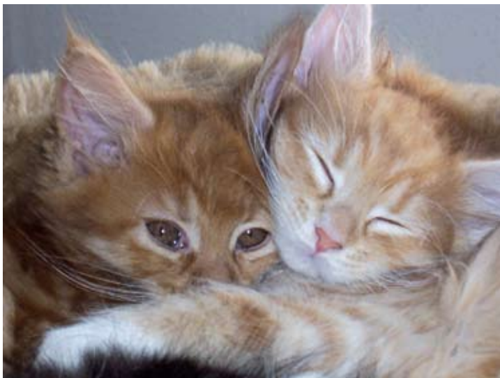
Små killinger bør have en legekammerat, hvis du er væk hjemmefra mange timer om dagen.

Luk desuden dørene ind til rum, hvor der er bløde dyner, tæpper, håndklæder, osv. Hvis der ikke bliver vasket af i Rodalon, kan kattene lugte tisset igennem næsten hvad som helst, også selvom I lufter dynen. I tilfælde af, at det er hunkatten, der er urenlig, og hun er steriliseret, og alt andet er prøvet, kan en hormonindsprøjtning måske afhjælpe problemet, men det skal dyrlægen tage stilling til i sidste ende.