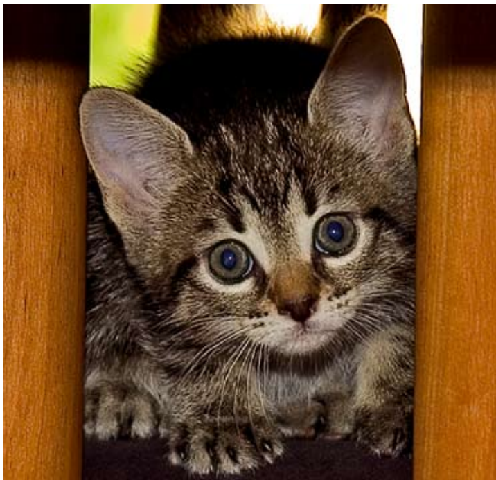
HUSK at killinger skal til dyrlægen for sundhedscheck, vaccination og orme- samt loppekur.

En kat, man ikke kender fortiden på, men som bliver fundet lidt forkommen som jeres, bør altid behandles hos en dyrlæge, så katten kan få en god start hos den nye ejer. Husk at få en god snak om foder, så den kan få mere sul på kroppen.