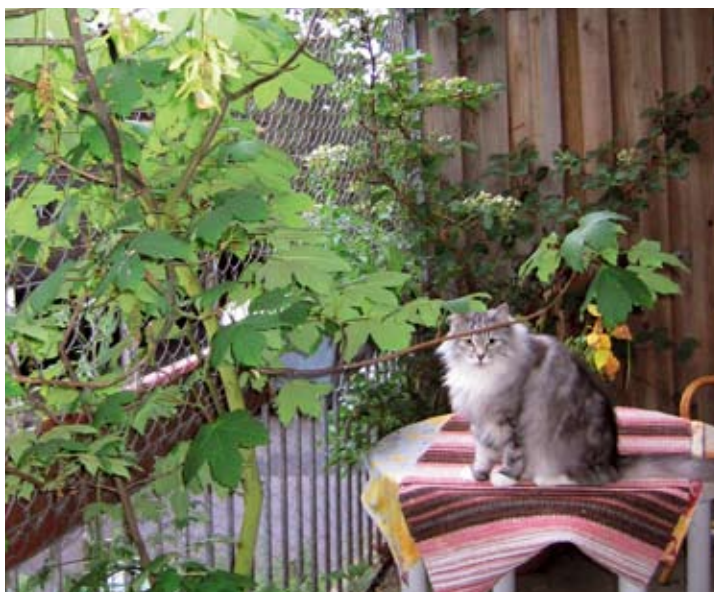
Evas altan med net fra bund til top. Kattene kan få frisk luft uden at kunne stikke af.

Eva Binding bor i en lejlighed sammen med tre tidligere hjemløse dyr; to dejlige katte