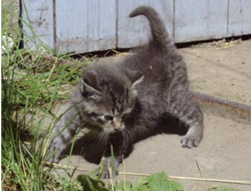
Tusindvis af overskudskillinger efterlades hvert år til deres egen skæbne.

I dag er det allerede praksis, at de nye ejere skriver under på, at de vil sørge for, at få katten neutraliseret. Men desværre er der mange, der ikke overholder aftalen. De vender i