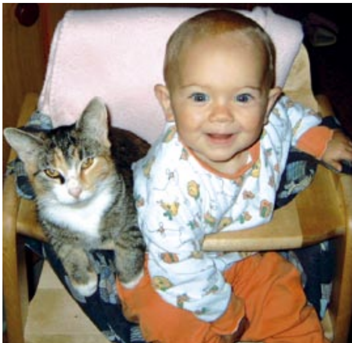
Børn har utolig godt af at vokse op med dyr.

Børn er med til at bestemme, hvordan dyrene skal behandles i fremtiden. Derfor er det vigtigt, at forældre sørger for, at børn har med dyr at gøre. Kattehjemmet er meget varm fortaler for, at børn vokser op med dyr, idet de så lærer at omgås levende væsener og behandle dem med respekt og empati. Mennesker, der er ligeglade med dyr og fx kan finde på at sætte et kæledyr ”ud på gaden” til sin egen skæbne, har ikke lært at sætte sig ind i de lidelser, det kan påføre dyret. Hvis børn får et fornuftigt forhold til dyr, vil dyrene blive behandlet bedre. Forholdet til dyr generelt har noget at gøre med folks holdninger til dyrevelfærd eller mangel på samme.