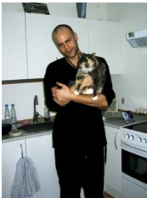
Katten Sheba hjemme hos sin ejer efter mere end ni måneder i det uviste.

lan gjorde var at melde katten efterlyst i Dansk Katteregister. Dernæst satte han sedler op i midtbyen og gik rundt i kvarteret med søsterens børn og ledte længe efter katten. Men der var ingen spor at finde nogen steder.