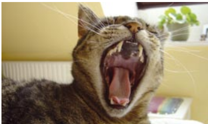
Lige meget hvor meget katten "råber" op og brokker sig, så skal den holdes inde i ca. 2 uger i et nyt hus, inden man lukker den ud.

Jeg har en neutraliseret han- og hunkat på henholdsvis tre og fem år, som er udekatte. Mit problem er, at jeg får besøg af andre katte fra nabolaget via kattelemmen om natten, som tømmer deres madskåle. Jeg syntes, det ville være synd, hvis de ikke kan komme ud om natten, da de er mest aktive der. De sover hele dagen. Hvorfor jager de ikke de andre katte væk?