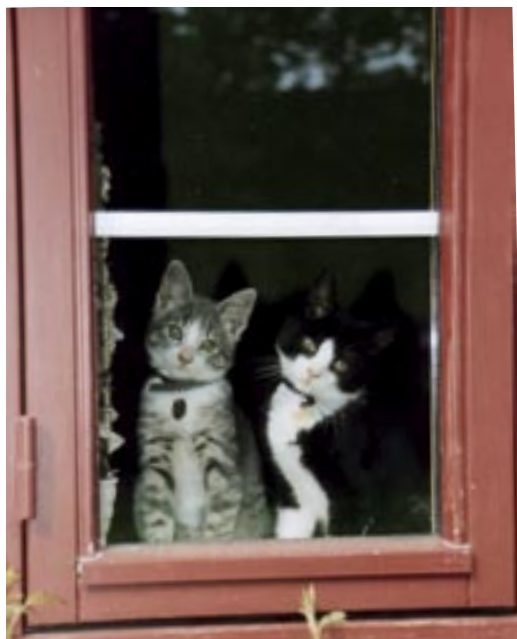
Yngre katte skal holdes inde, indtil de er blevet neutraliseret og øremærket.

Luk ikke killinger udenfor, før de er blevet neutraliseret (steriliseret/kastreret) og øremærket. Du risikerer, at killingen løber for langt væk og ikke kan finde hjem igen. Killinger er nysgerrige, bliver nemt distraheret af spændende ting og har ikke samme stedsans som en ungd og voksen kat. Hvis du lukker en killing ud, inden den er blevet øremærket, er det så godt som umuligt at finde frem til rette ejer igen. Vildfarne killinger er desuden et nemt bytte for hunde, katte og en sulten ræv. Eller mennesker tager dem, fordi de tror, de ikke har nogen ejer. Rigtig mange mennesker mister desværre deres killinger på denne måde, fordi de lukkes ud for tidligt!