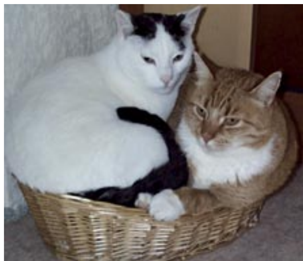
"Lige børn leger bedst." Kat nr. to, der anskaffes, bør passe til kat nr. et aldersmæssigt og sindsmæssigt.

Dårlig mave kan skyldes pludseligt foderskifte eller stress. Benyt Intestinal-foder af Royal Canin, som fås hos dyrehandleren eller dyrlægen. Og køb Zoolac hos dyrlægen eller på apoteket. Det er et tilskud af mælkesyrebakterier, der genetablerer den normale mave- tarmfunktion. Hvis det ikke hjælper, skal dyrlægen opses.