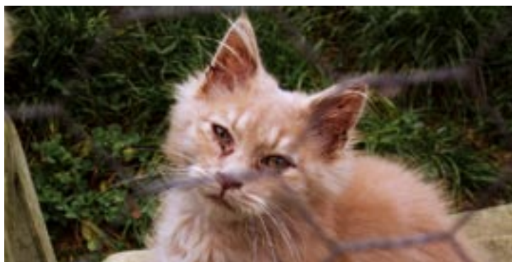
En misrøgtet kat fra en "kattefabrik".