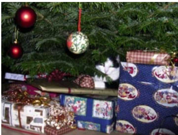
Katten gemmer sig lige i "farezonen".

• Træk gardinerne/persiennerne for og tænd lyset, så katten ikke kan se glimtene. Lad radioen eller fjernsynet køre, som tager baggrundsstøjen.