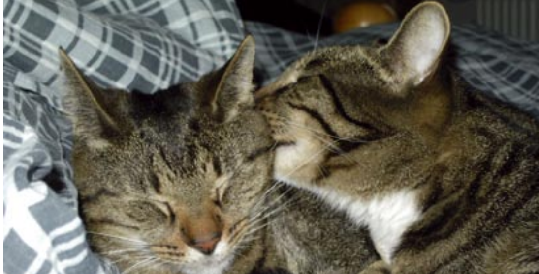
To katte vasker hinanden

eller aflives, som også bliver udfaldet, når katten først begynder at vise tegn på sygdom.