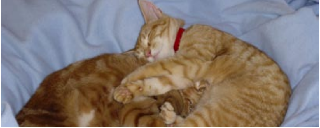
To katte, der holdes indendørs, har stor glæde af hinanden.