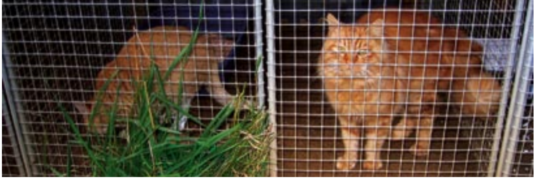
At leve livet på én kvadratmeter tilgodeser ikke kattenes behov.

finde, men at de kan mødes på X station og afhente katten.