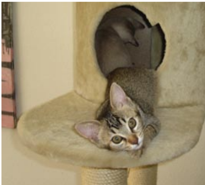
To killinger leger sammen i deres kardsetræ

råder dig til at anskaffe to katte på samme tid, da de så kan holde hinanden med selskab, når du ikke er hjemme. Det er ikke nogen god idé at gå tur med din kat, hvis der er meget trafikeret, hvor du bor. Hvis du derimod bor et sted med et roligt gårdmiljø, kan det være en mulighed at gå med katten dér. Du skal blot vide, at det forpligter, hvis du først begynder at "lufte" din kat. Du kan også overveje at bygge en løbegård til katten eller indhegne din altan, hvis du har sådan en.