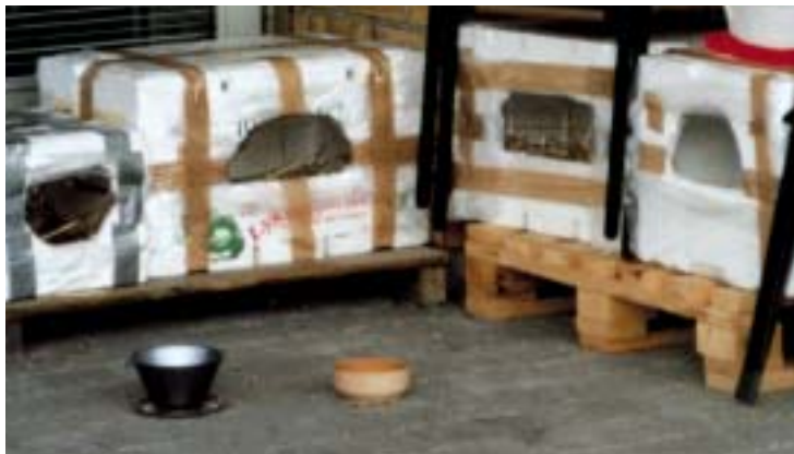
Forslag til hvordan redekasser kan bygges og stilles op

Inges Kattehjem ønsker alle vores læsere et godt efterår.