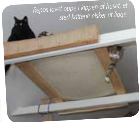
Repos lavet oppe i kippen af huset, et sted kattene elsker at ligge.