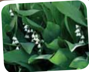
Liljekonval - alt ved planten er giftig, specielt bærrerne som kommer til efterår.

Giv din kat mange sjove oplevelser - både ude og inde