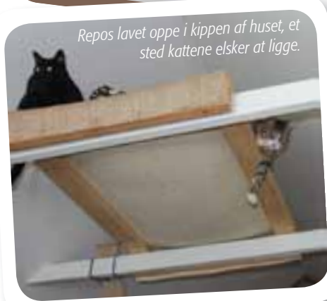
Repos lavet oppe i kippen af huset, et sted kattene elsker at ligge.