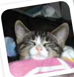
Olsen trænger vist til en sjov leg...