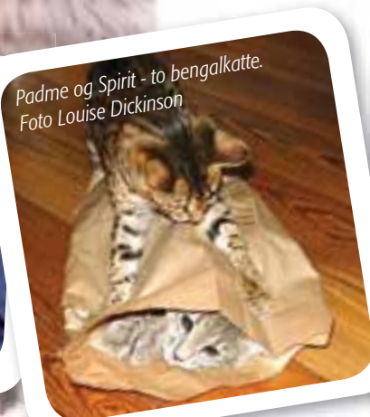
Padme og Spirit - to bengalkatte.