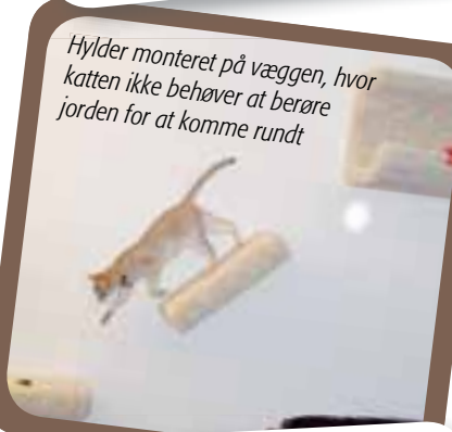
Hylder monteret på væggen, hvor katten ikke behøver at berøre jorden for at komme rundt