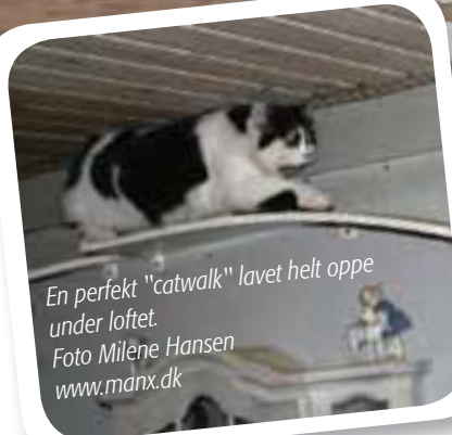
En perfekt "catwalk" lavet helt oppe under loftet.

I soveværelset vil de fleste katte gerne ligge på klædeskabet, hvis der er plads, og vil sikkert sætte pris på en eller flere afsatser i form af stole, hylder el. lign.