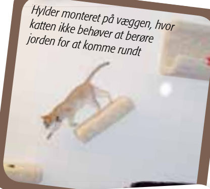
Hylder monteret på væggen, hvor katten ikke behøver at berøre jorden for at komme rundt