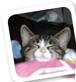
Olsen trænger vist til en sjov leg...